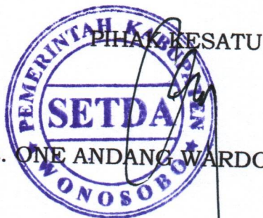
Drs. ONE ANDANG WARDOYO, M.Si

Demikian Perjanjian ini dibuat dan ditandatangani oleh PARA PIHAK di Wonosobo pada hari dan tanggal sebagaimana tersebut diatas dan dibuat dalam rangkap 3 (tiga), lembar kesatu dan lembar kedua bermaterai cukup yang masing-masing mempunyai kekuatan hukum yang sama.